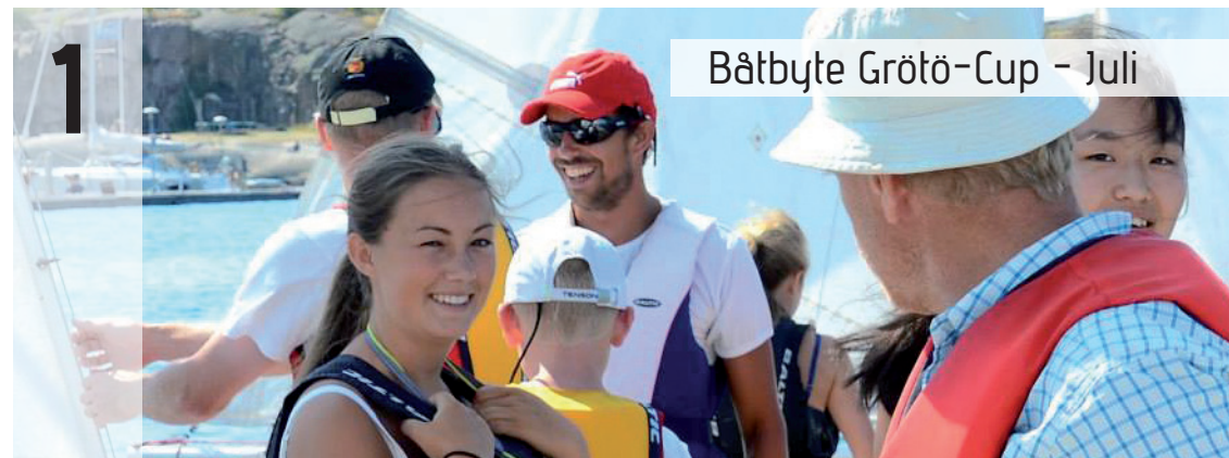
Båtbyte Grötö-Cup - Juli