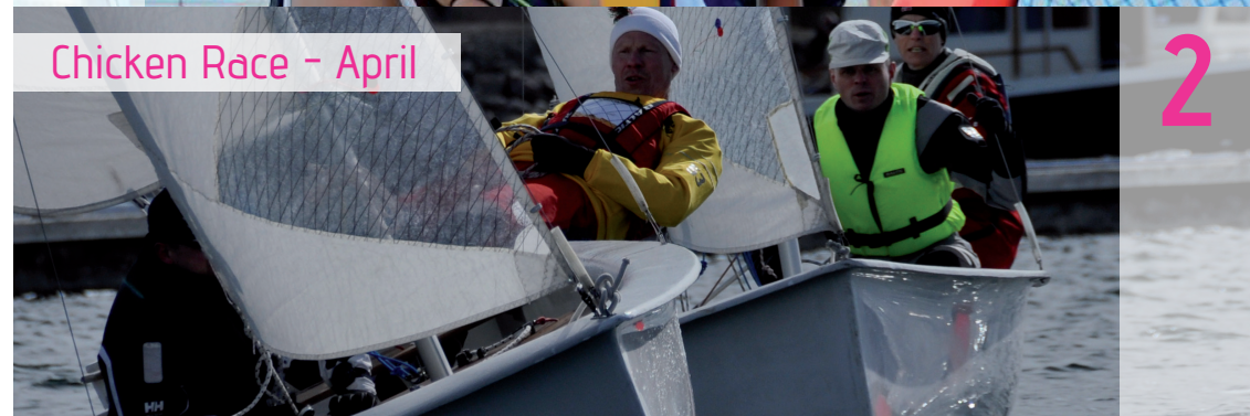
Chicken Race - April