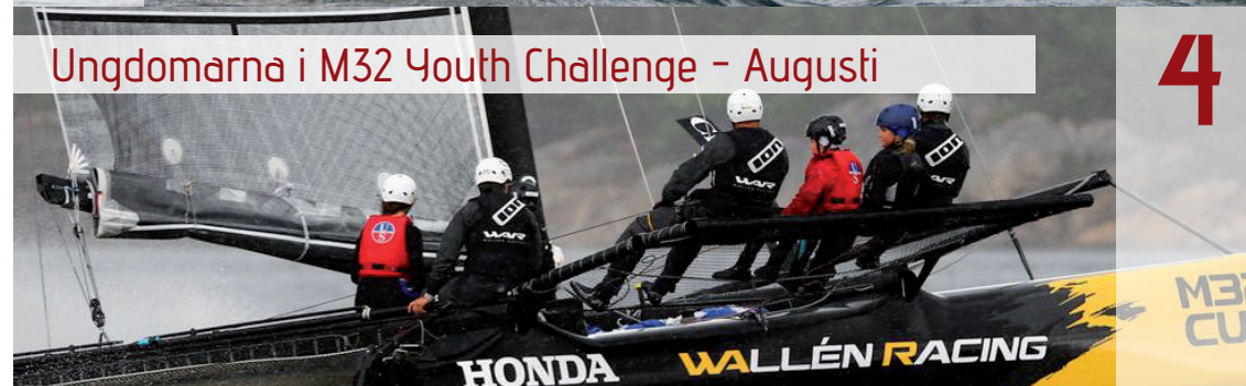
Ungdomarna i M32 Youth Challenge - Augusti