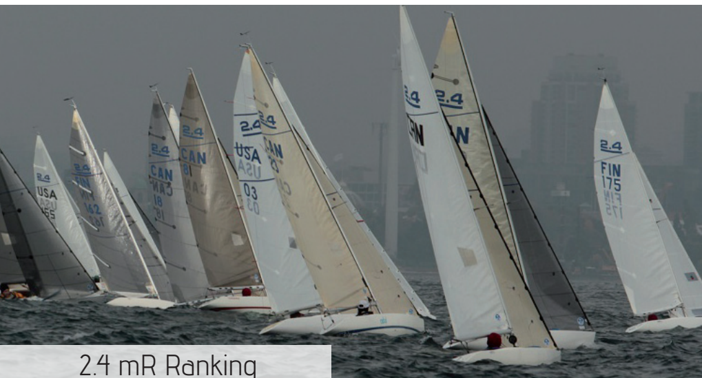
2.4 mR Ranking