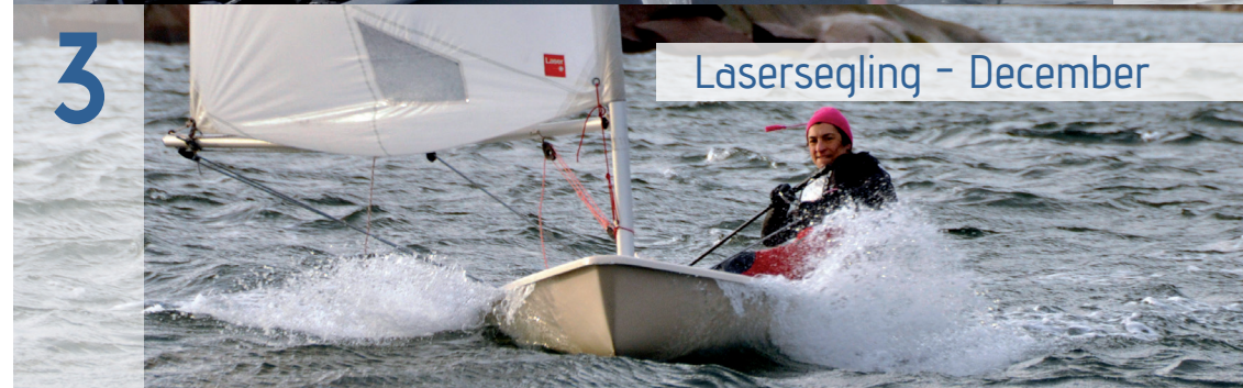
Lasersegling - December